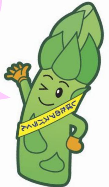
新発田市 アスパラくん