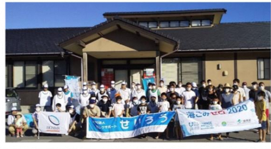
他団体とも一緒に活動します