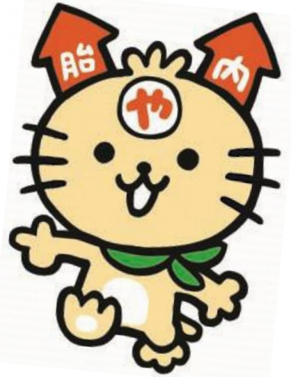
胎内市 やらにゃん