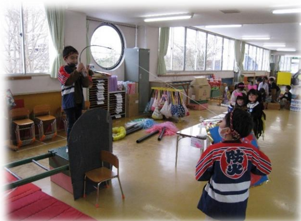
こうすると、本当に釣ってるみたいじゃない？

友達と気持ちを合わせ、恥ずかしさを乗り越えて表現できるようになるのも5歳児です。3年間の園生活での経験が、自信をもった表現につながります。