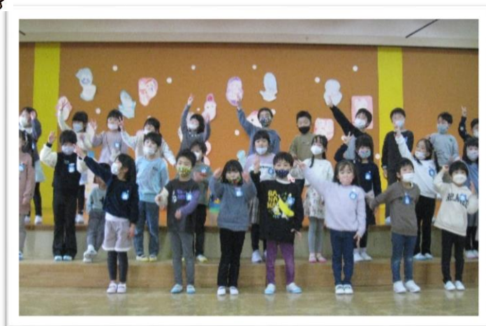
手話教室(12月)で習った♪にし