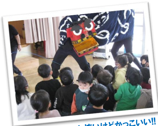
うわ〜っ!!ちょっと怖いけどかっこいい!!