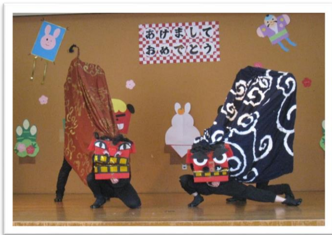
“無病息災”を祈って!