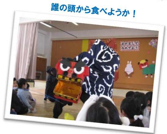
誰の頭から食べようか!