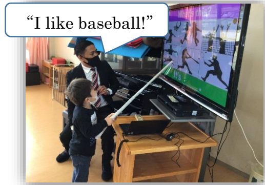
“I like baseball!”