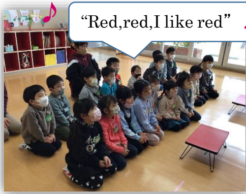
“Red, red, I like red”