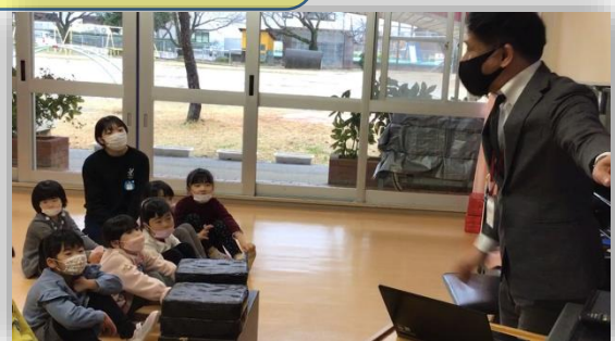
♪ “It’s a present!”