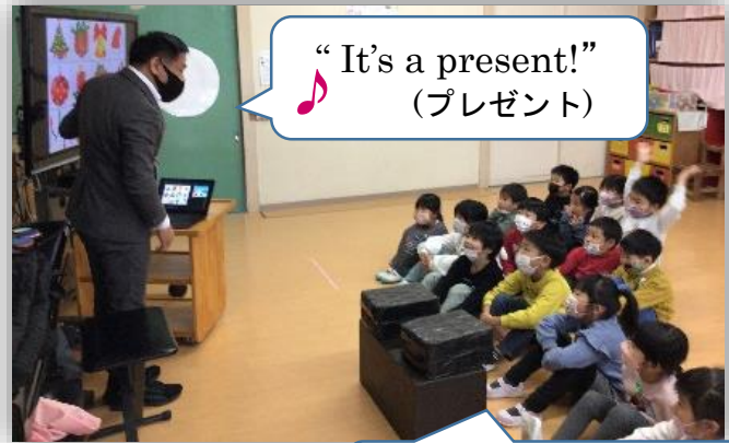
♪ “It’s a present!” (プレゼント)

まもなくやってくるクリスマス。子どもたちは、おなじみの登場人物やグッズに興味をもって楽しく取り組んでいました。