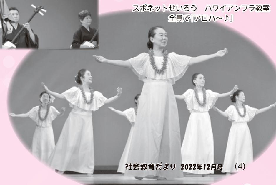
スポネットせいろう ハワイアンフラ教室 全員で「アロハ〜」