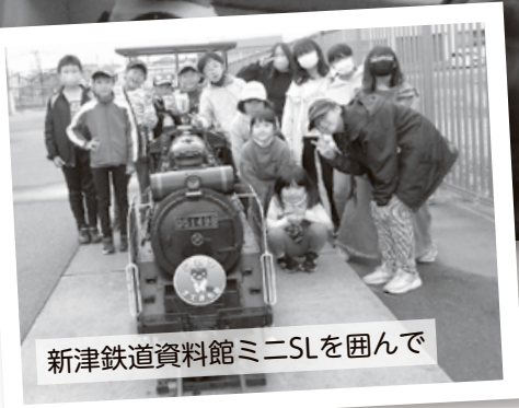
新津鉄道資料館ミニSLを囲んで

子どもたちが待ちに待ったこの日！雷神様も見て見ぬふりをしてくれて、新津鉄道資料館、信濃川ウォーターシャトル乗船、朱鷺メッセ展望ラウンジでのゴジラ目線体験の旅を楽しむことができました。 ウォーターシャトルの船上ではウミネコたちが子どもたちを歓迎して……ではなく、指の先に持つて差し出すえびせん目当てに船を追って飛んできました。種を越えた楽しいコミュニケーションを体験できました。