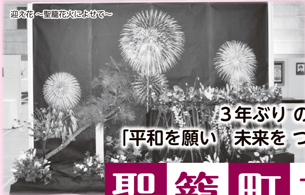
迎え花～聖籠花火によせて～