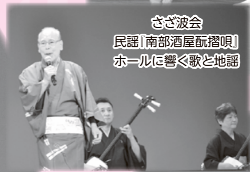
さざ波会 民謡『南部酒屋祝唄』 ホールに響く歌と地謡