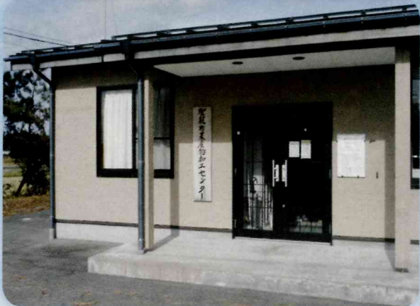
聖籠町農産物加工センター 聖籠町大字蓮野 3222 番 Tel 0254-20-7212

農産物加工センターは、農家のみなさんが味噌、餅、漬物、米粉を加工するための施設です。