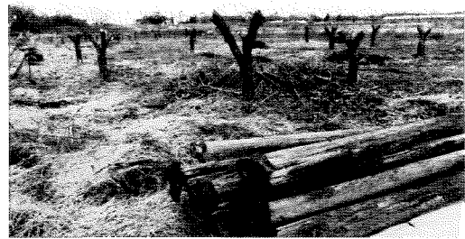
農地として再利用するため作業中!