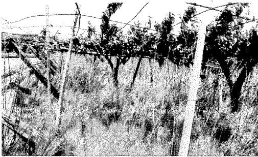
遊休農地の整備費の2/3を補助