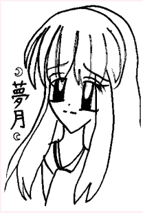
なそのウルトラマン・11歳