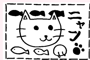
いちごジャム・13歳