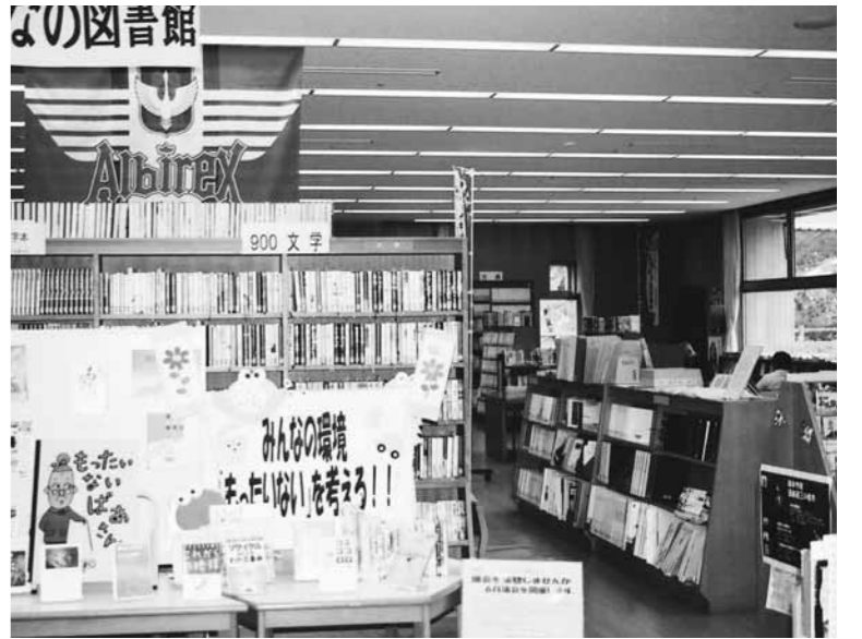
図書館を活かす町づくり

問 図書館の事業内容が充実していく過程の中で図書館が抱える課題はたくさんあった。 町長 図書館長を社会教育課長が兼任していたことも課題の一つであったが、平成16年度から専任の館長が配置された。 しかし、21年度の人事異動で専任だった図書館長を元の兼任体制にした。職員の人事は町長の持つ権限の一つである。 町長の図書館に対する政策は後退したのか。 町長 館長人事については、教育委員会と町長部局の調整の中で行った。その時々々の行政課題や政策を加味して、総合的に勘案した中で人事を決