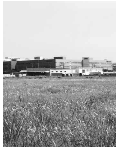
新潟東港工業地帯

新潟東港立地企業の土地利用の変化により他業種への用途変更等の相談があり、また、住民票を有する者が増加しています。新潟東港工業地帯における一部工業地域について、工業機能の増進及び用途混在の防止を図り、住宅、福祉施設及び遊戯施設等の立地を制限するためのものです。