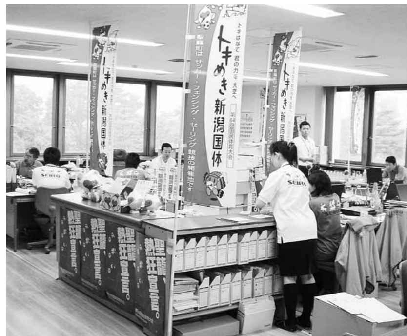
国体本番にむけて準備 (国体推進室)

平成21年第4回臨時議会が5月29日、1日間の日程で開催されました。専決処分の承認を求める「聖籠町条例等の一部改正」「聖籠町国民健康保険条例の一部改正」2件と「聖籠町職員の給与に関する条例等の一部改正する条例」について審議され可決しました。