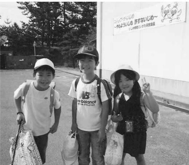
元気にはばたけ子どもたち

問 景気後退による町民の生活、経済不振に対する施策としてプレミアム商品券の販売を商工会に町が委託して開始し、町民には喜ばれたが、事業の成果は、検証できたのか。 町長 商工会の検証については登録加盟店の換金の期日が6月末ですので、その後最終的な事業効果を検証する。