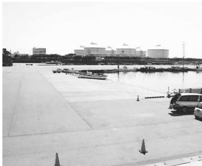
整備がすすむ網代浜船だまり

町長 網代浜船だまりでのクラブハウス整備、船上イベント、海の釣り堀りなども今後考えていく必要もある。 保安林については、植樹をしているところであり、人工的に手を加える計画は難しいが、加治川左岸については、海岸の保安林を一体的に活用した道の駅的な構想も考えている。