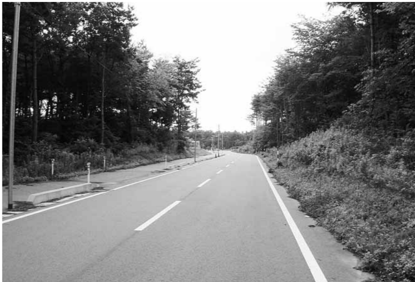
整備がすすむ山辺川線

町長 亀塚山辺川線は、入沢商店の丁字路から、通学路の方にぬけ十字路となる。次第浜山辺川線は、次第浜紫雲寺線から亀代こども園まで900メートルを行う。