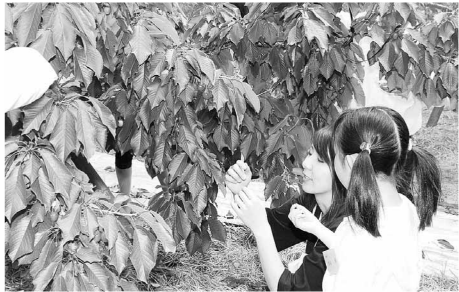
おいしいな さくらんぼ

実行がより効果的に機 能するように、総合計画 との整合性も考えながら 「魅力ある農業の調査委 員会」を立ち上げ衆知の 結集をしながら、本町農 業の振興をはかる。