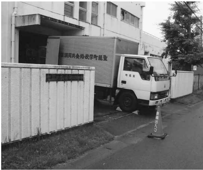
整備が待たれる蓮瀉こども園