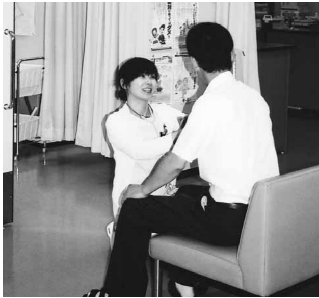
こまめに健康診断

問 後期高齢者医療制度で無保険の状況にさせるべきでない。国民健康保険加入者で病気になる子どもに限定せず、短期証を発行すべきである。高すぎる国保料の引き下げ、窓口負担の軽減