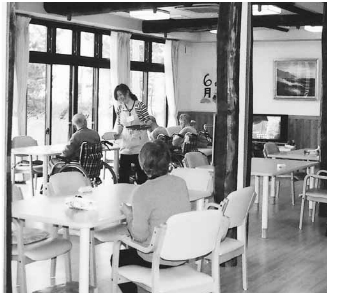
だれもが望む安心な老後

町長 当日は担当職員2人で対応したが、緊張のあまり町民に迷惑をかけたことは反省している。そういう時こそ冷静沈着に的確な情報提供ができればよい対応していきたい。