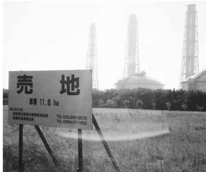
企業誘致が待たれる東港

ひとり暮らし老人、同居老人などの要介護に至つてない人もいる。今後も総合的な対策が必要かと思う。