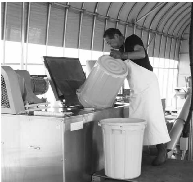
拡大される生ごみ処理

問 4月から実施予定の 生ごみ処理地域拡大計画 が、4月から2カ月余り 経過しても、関係集落へ の説明会さえ行われてい ない理由は何か。 同じように予算執行が 遅れている事業は他にな いか。 4月から新規事業とし て発足させた消費者相談 センターは、順調にスタ ートし、消費者センター の設置を考えていると聞 いたが、具体的内容は。 町長 事業の執行につ いて、スピード感が大事な ことと常に職員を指導し ている。 生ごみ処理範囲拡大事 業もそのひとつだが、計 画を実行に移すのに時間 がかかる場合もある。 7月からの実施に向け て準備を進めている。 消費者行政については 老人クラブからの要請で、 消費者生活出前講座など も開設したり、啓発活動 も取り組んでいく。 1階住民相談室の場所 に、消費者センター設置 に向けた準備を行ってい る。