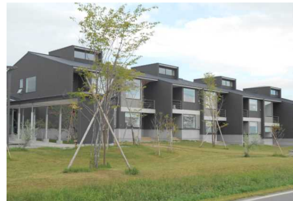
▲オークフィールド八幡平：住棟

【居住機能のイメージ】若者、ファミリー、シニア層といった様々な年代のニーズに沿った住宅を提供する。