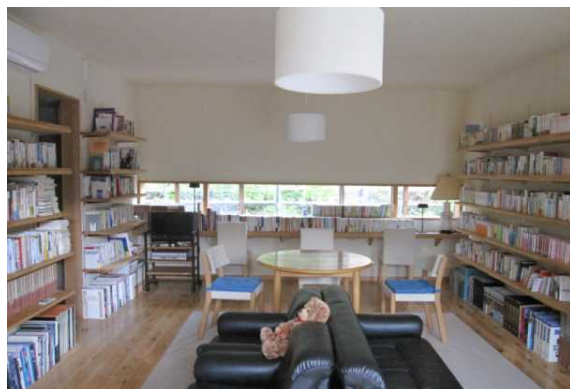
▲ゆいまーる那須：ライブラリー

【居住機能のイメージ】若者、ファミリー、シニア層といった様々な年代のニーズに沿った住宅を提供する。