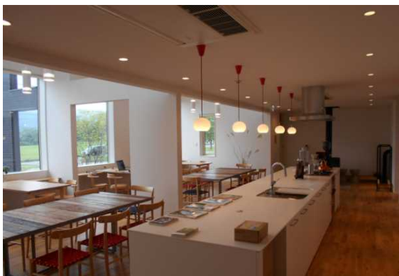
▲オークフィールド八幡平：レストラン

【交流機能のイメージ】入居者と周辺住民が気軽に利用し交流できるよう、飲食、文化、健康増進機能などを導入する。