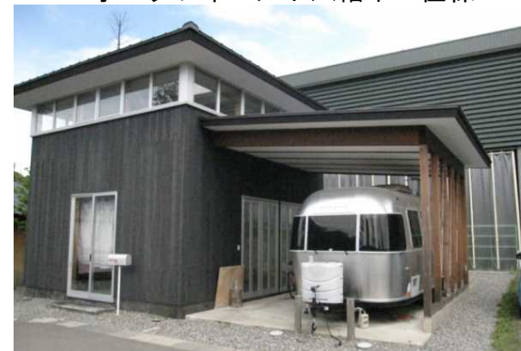
▲シェア金沢：学生向け住棟