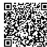
寄附実績一覧 (町ホームページ)

URL: https://www.town.seiro.niigata.jp/1/3/1/1/1/3170.html