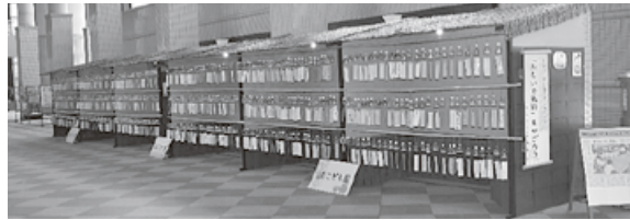
手前から蓮野・蓮濁・亀代の各こども園