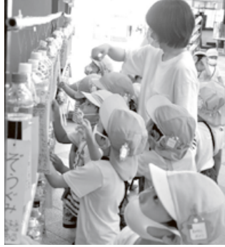
ぼくわたしの風鈴どこかな～ あった！