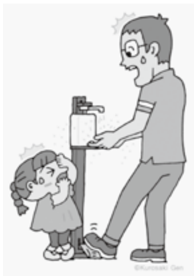
子どもサポート情報より