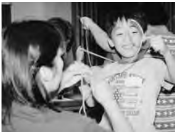
毛糸を巻いてシャボン玉の枠作り

シャボン玉液もできあがり、いよいよ飛ばそうという頃、外はあいにくの雨でしたが、「せっかくだから外でやろう」と雨の中で挑戦。