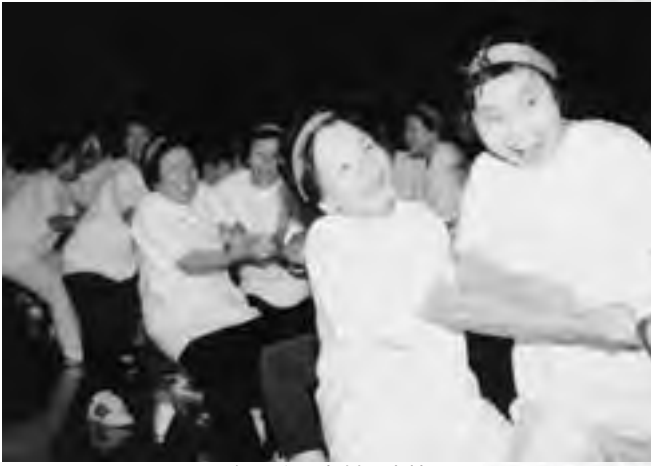
楽しくも真剣な表情

山大学。「目指せ3連覇」を合言葉に、気合の入った練習会を実施してきました。競技がはじまると練習の成果が発揮され、各大学との点差はみるみる広がるばかり。圧倒的な強さを見せ優勝かと思わ