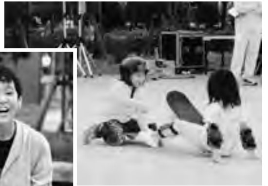
将来はプロスケーター?