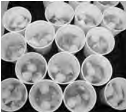
(みらいのたね 佐藤)

今回、白玉をたくさん作ったので、先生方にもたべてもらいました。次回は、教材園で育てたさつまいもで、和菓子を作る予定です。