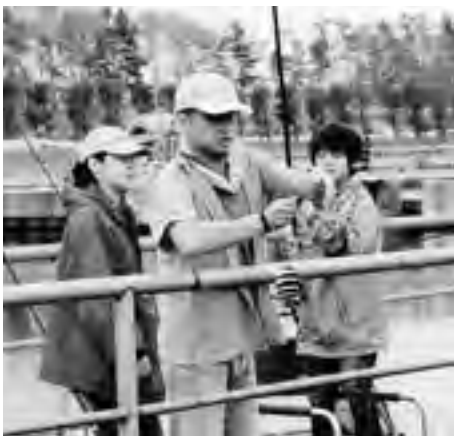
感じます。楽しい1日だったことを

表彰式の後には、トン汁でお腹を満たし、有意義な秋の1日を過ごされました。東北電力さんのご好意に感謝申し上げます。