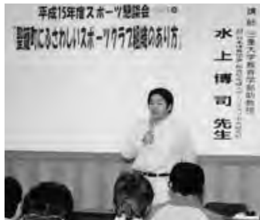
昨年のスポーツ懇談会の様子