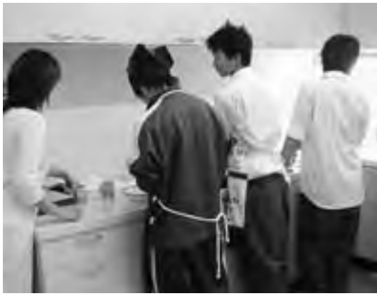
おやつ作り特訓中の様子

3年生の家庭科の授業で、町内の保育園児、幼稚園児、子どもサークルを招き、いっしょに子ども向けおやつ作りをするようになりました。本番を前に試作してみようと、「どんぐりたね」のお母さんたちも手伝うことになり、班ごとにレシピを練り、カップケーキやマドレーヌ、白玉などに挑戦。