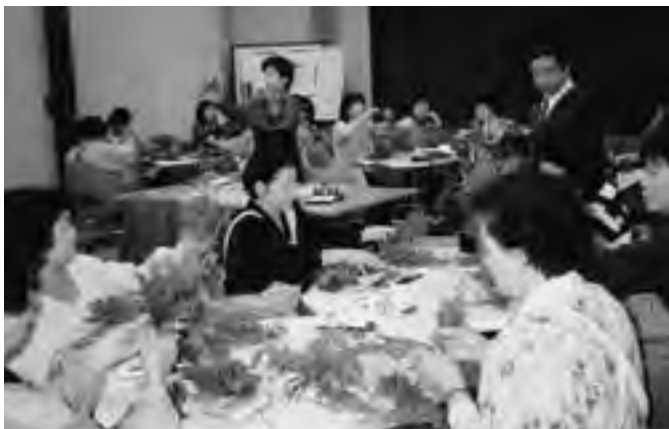
前回の受講の様子