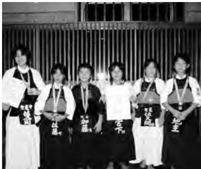
入賞した剣道クラブのみなさん

剣道クラブの活動内容や大会結果はホームページでもご覧になれます。アドレスは http://www11.ocn.ne.jp/~machken/