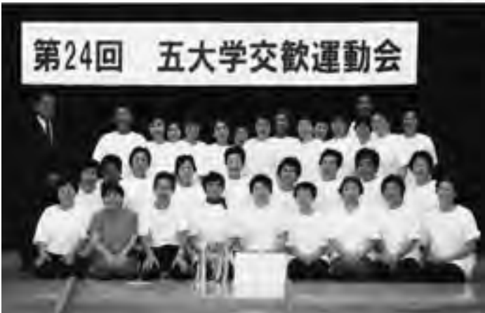
準優勝杯を前に記念撮影

れましたが、最後の種目「一発逆転玉入れ競争」(入れた玉の2倍が得点)で紫雲寺町の五葉大学に逆転され2位。得点差は4点。残念ながら玉2個分で優勝を逃してしまいました。しかしながら、聖山大学生の顔は晴れやかで、さすがしく感じられました。