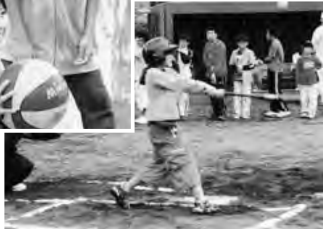
目指すは大リーガー!!