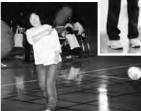
気軽に手軽にミニテニス