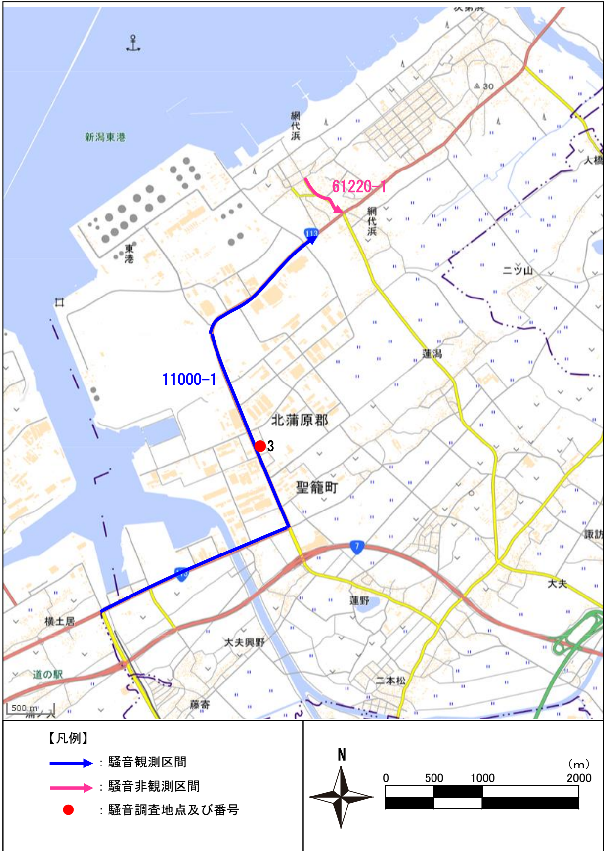
図 4.1 評価区間位置図 (路線名：一般国道 113 号、一般県道網代浜新発田線)